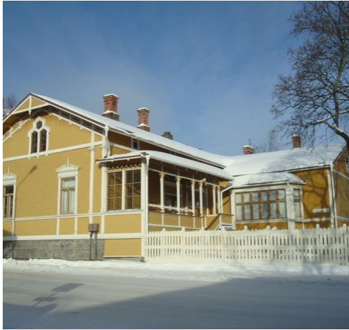
Päiväkotirakennus Kauppakatu 61