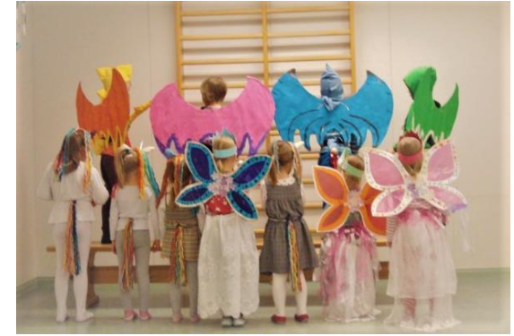
Karnevaalin pukuloistoa 2017

Yksityisen hoidon palvelusetelin (Kuopio) jälkeen hoitomaksu on kokopäivähoidossa enintään 325,00€.